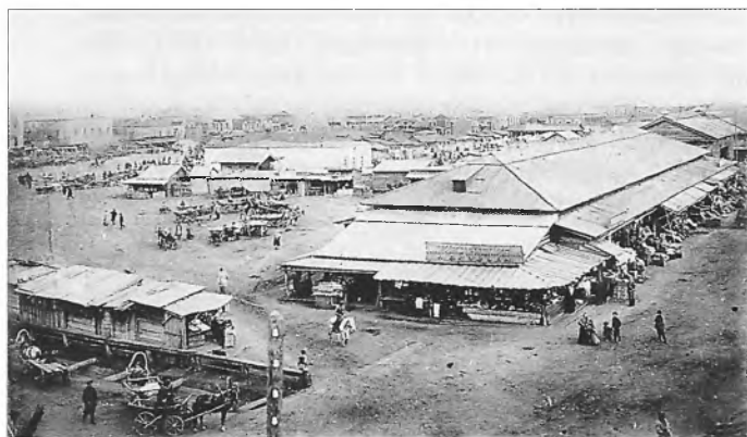
Хлебный базар на Арсенальской площади. Фото конца XIX в.

трудно установить, а иные и невозможно. Вряд ли найдётся и знаток старого Иркутска, способный выполнить очень важную и интереснейшую работу, начатую Н. Романовым, так, как это сделал бы он.