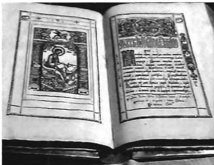
Редкое издание из собрания Н.С. Романова в фонде НБ ИГУ