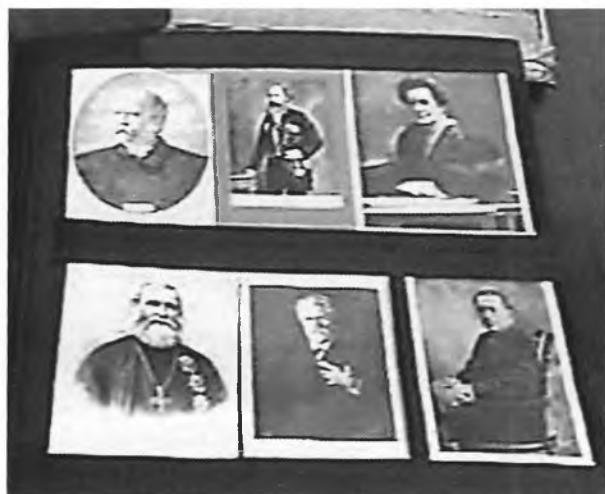
Страница альбома из коллекции Н. Романова

Некоторые из них были опубликованы в издании, посвящённом 300-летию присвоения Иркутску статуса города 45 . К сожалению, каталога собрания, его описания и научной оценки во взаимосвязи с историей картографии Иркутска до сих пор нет.