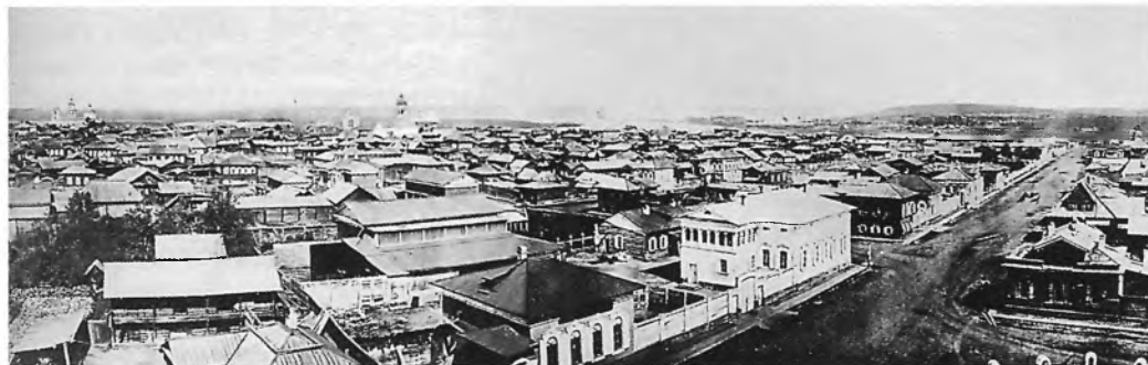
Панорама Иркутска до пожара. Снято с колокольни Благовещенской церкви. второй половины XIX в.

Для изучения коллекции изобразительных материалов по истории города Н. Романова большой интерес представляют некоторые его рукописи. Одна из них — «Список фотографий, литографий, видов города Иркутска» (ф. НБ ИГУ, рук. № 526, 138 л.), которые не вошли в альбомы. Среди них небольшую, но очень ценную часть составляют фотографии допожарного Иркутска (1850–1870). По имеющимся сведениям, в государственных и частных коллекциях находится 49 фотографий, на которых запечатлены Иркутск и его пригороды 50–70-х годов XIX века 40 . Это самые ранние фотографические документы, по которым можно судить об облике города, его площадях, улицах, набережных до пожара 1879 года. Автор многих из них — один из первых иркутских профессиональных фотогра-