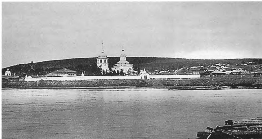
Иркутский Знаменский женский монастырь. Фото И.С. Жутеева начала XX в. НБ ИГУ

навливают свою родословную. А сколько ещё важного и интересного можно найти в этом рукописном фолианте! Продолжив мемуарную традицию иркутян, Нит Степанович писал относительно данной работы: «Буду жить, ещё буду писать».