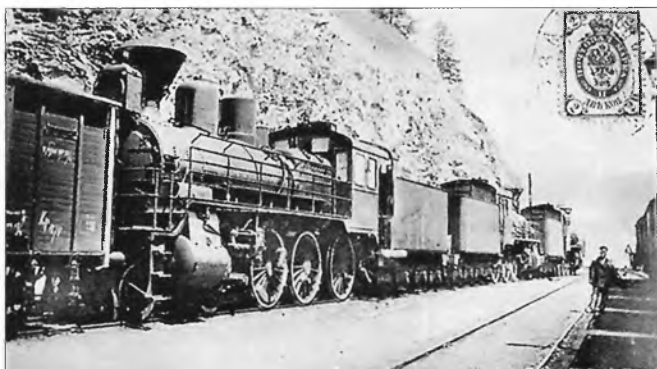
Кругобайкальская ж. д. — Chemin-de-fer autour de Baikal. № 33. На с1 перекр. — St. Bathal.