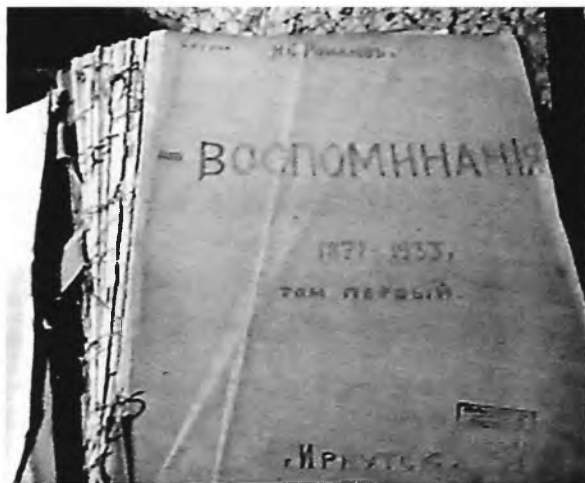
Романов Н.С. Воспоминания иркутянина 1871–1933. Рукопись. НБ ИГУ

заметкам автора в дневниках последующего периода, воспоминаниях, они велись. Дневники или не сохранились (но ведь, по его словам, он дорожил «каждым исписанным листком» и всё бережно хранил), или не поступили в архив в связи