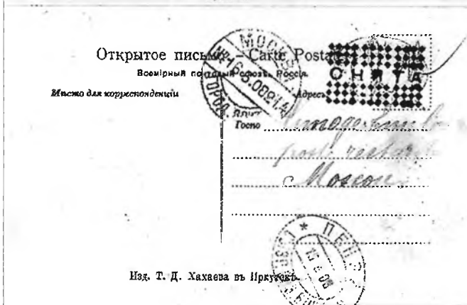
Изд. Т. Д. Хахаева в Иркутске