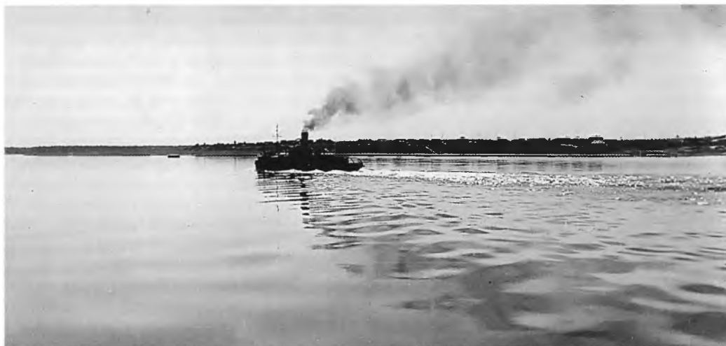
Вид на Балаганск с р. Ангары. Фото начала XX в.

Известно, что по делу бояр Романовых и других Борис Годунов «разослал в поморские городы, и в Сибирь, и на Волгу, и на Терек, и в Пермь Великую в темницы и в пустые места» 4 многих бояр, дворян, служилых, военных и иных людей. Некоторые из них попали в опалу и были отправлены в Сибирь на службу