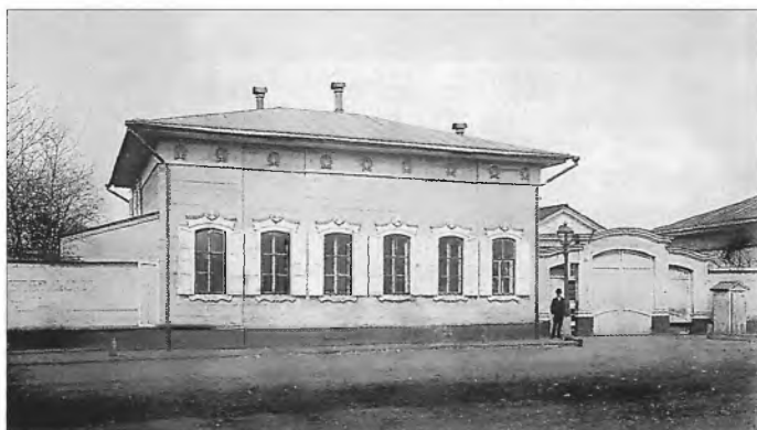
Дом декабриста П.А. Муханова на Преображенской улице. 1903

О ценности собрания фотографий коллекционера свидетельствует и материал по фотофиксации декабристских мест старого Иркутска 42 . В их числе есть один из самых ранних снимков дома Волконских 1890-х годов (№ 5548/33) работы Петра Адамовича Милевского, польского ссыльного, известного сибирского фотографа, и изображение этого дома, предположительно, в 1920-х годах с фасада (№ 5546/23) и со двора (№ 5550/56). Уникальный снимок дома Трубецких на бывшей Арсенальской улице (ныне ул. Дзержинского, 64 — № 5546/42) — единственный документальный источник для восстановления фасада дома в первоначальном виде. В собрании Н. Романова сохранилась и фотография 1890-х годов (№ 5548/42) с видом первого дома Трубецких в Знаменском (ныне Маратовском) предместье Иркутска. С 1874 года в нём находилось Иркутское ремесленно-воспитательное заведение им. Н.П. Трубецкова. По сообщению в летописи