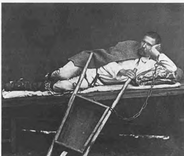
Прикованный к тачке, лежащий на нарах. Нерчинск. 1891.

В Нижнем ссыльных пересадил на арестантскую баржу, которой по Волге они добились до Перми.