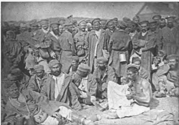
Группа каторжан на дооге за Томском.

всего, были определены общие принципы, полномочия и порядок работы органов управления ссылкой. Согласно законодательным актам, для приема, распределения и учета ссыльных создавался Тобольский приказ, а на местах – ряд экспедиций о ссыльных: казанская, томская, енисейская и иркутская. С Уставом впервые у ссыльных появились документы