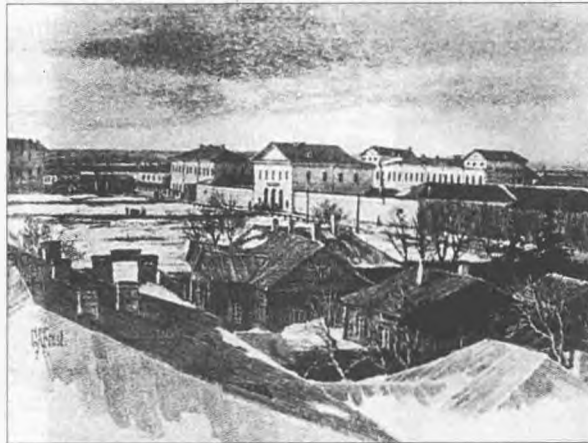
Д. Фрост. Тобольская каторжная тюрьма. Воспроизведено из книги Дж. Кеяна «Сибирь и ссылка. Путевые заметки (1885–1886.)» (СПб., 1999. Т. 2)

Не все пашенные ссылные мирились со своей долей, немало бежало дальше на север или в Дауры.