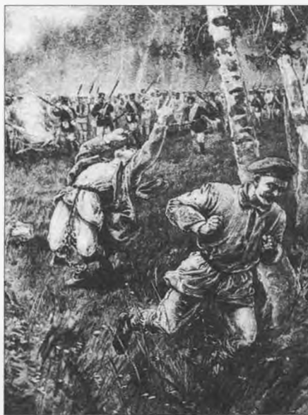
Д. Фрост. Побег на уру. Воспроизведено из книги Дж. Кеннана «Сибирь и ссылка. Путевые заметки (1885–1886 гг.)» (СПб., 1999. Т. 1)

Вот как описывает свой этап в якутскую ссылку Е.К. Брешко-Брешковская: «Когда же мы водворились на «паузке» – вид большого плота с обширным крытым сараем на нем, без окон, но с широкими воротами и крышей, покатою настолько, что на ней можно не только сидеть, но и прохаживаться; внутри широкие нары с обеих сторон, но т. к. все