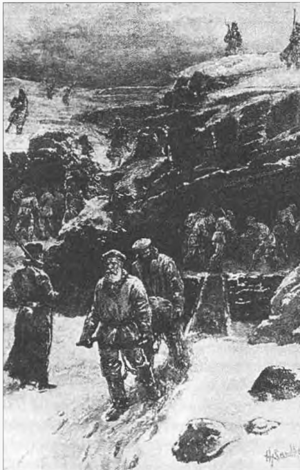
Д. Фрост. Каторжане за работой на Карийских золотых приисках. Воспроизведено из книги Дж. Кеннана «Сибирь и ссылка. Путевые заметки (1885–1886 гг.)» (СПб., 1999. Т. 2)

и ярких впечатлений, с хронометрической точностью воссоздавшая все мытарства ссыльных. Думается, вполне уместным будет привести ее здесь в нашем изложении.