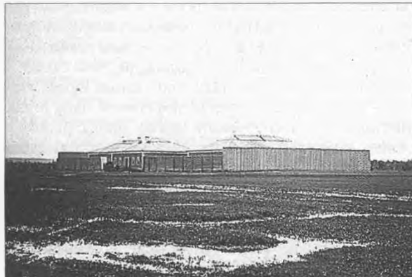
Барак для каторжан на этапе.

Путь от Верхнеудинска тянулся дальше – до Нерчинского. Это еще 25 этапов и полуэтапов. По-