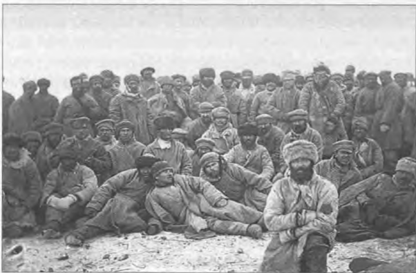
Группа каторжан в Сибири.

Прибывшие на место ссыльные за счет казенных средств строили дома и хозяйственные помещения. Поселенцев освобождали на три года от подушных платежей и повинностей. На каждого взрослого государство выдавало возвратную натуральную ссуду – два сошника, два серпа, топор, косу, а также одну лошадь на семью. Кроме того, взрослым работникам, независимо от пола, полагалось по копейке