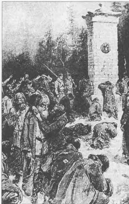
Д. Фрост. Сибирский пограничный столб. Воспроизведено из книги Дж. Кенна «Сибирь и ссылка. Путевые заметки (1885–1886 гг.)» (СПб., 1999. Т. 1)