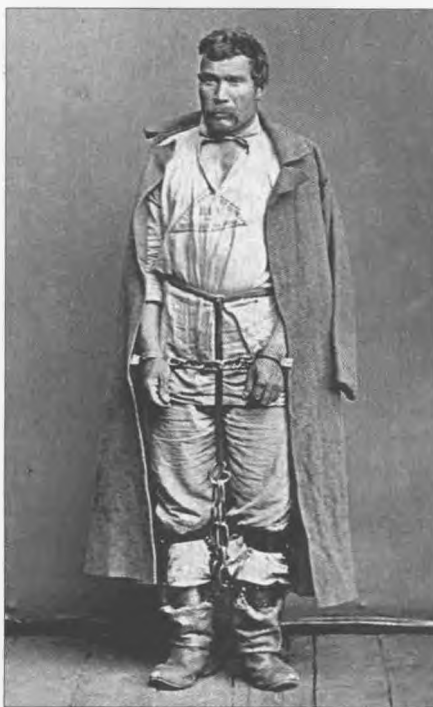
Закованный ссыльнокаторжный в ручные и ножные кандалы. Нерчинск. 1891.

Как видим, вся история Сибирского тракта теснейшим образом связана и с уголовной и политической ссылкой. С 20-х гг. XVII в Тюмень, а затем и дальше, шли партии участников дворцовых интриг и переворотов, стрельцы, казаки из «черкас», крестьяне, отправленные в Сибирь помещиками «за предерзости», уголовные преступники, бродяги, наконец, декабристы, петрашевцы, революционеры-народники, социал-демократы и эсеры. Несколько сотен тысяч ссыльных, прошедших этапным порядком по тракту, оставили заметный след в экономике обширного края: они активно участвовали в освоении территории, пахали государеву десятину, были среди первых посадских жителей, несли казацкую службу, дали основу для формирования промышленных рабочих. С отменой крепостного права, расширением рынка свободной рабочей силы и ее удешевлением применение подневольного труда стало невыгодным, однако государство, продолжало эксплуатацию ссыльных. Вместе с тем, принудительный труд, несмотря на кажущуюся дешевизну, был дорог и малоэффективен. Но это, как говорится, совсем