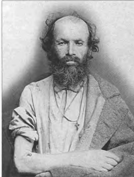
Клейменный ссыльнокаторжный. Нерчинск. 1891.

Побывал Птицын и на Усть-Кутском солеваренном заводе. Здесь он застал 51 каторжника и 17 вольных рабочих, большая часть из которых – те же осужденные, отбывшие свой срок обязательных работ и вышедшие на поселение. По словам управляющего, завод заказывает каторжан через иркутскую экспедицию о ссыльных. При этом сюда стараются брать только семейных – они никогда не бегают – и уж точно вообще не берут арестантов, отбывших хоть часть наказания в «централке», так как та-