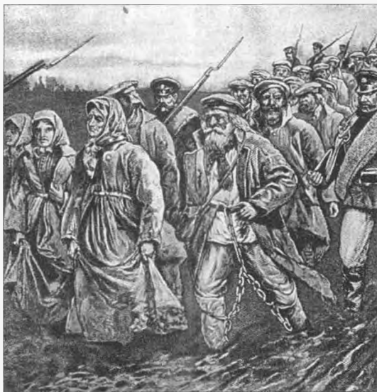
В дороге. На каторгу. Воспроизведено из книги «Живописная Россия» (СПб., 1895. Т. XII Ч. 1)

Ссылка этого периода носила также характер опалы: в Сибирь, в том числе и в Прибайкалье, отправлялись политические противники власти, участники заговоров и дворцовых интриг, а также «радетели за истинную веру». По всей видимости, первым известным политическим ссыльным был здесь протопоп Аввакум. В 1653 г. он за «многое безчинство» был сослан «з женою и з детьми в сибирский город на Лену». В декабре этого года Аввакум был в Тобольске, в конце 1655 г. – в Енисейске, в октябре 1656 г. – в Братском остроге. Вот как описал Аввакум свои злоключения: «Егда приехали к порогу, к самому большому, Падуну – река о том месте шириною с версту, три залавка через всю реку зело круты, не воротами што поплывет, ино в щепы изломает, – меня привезли под