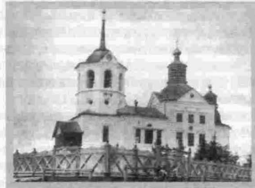
Село Петропавловское Церковь Св. Спаса Нерукотворного Образа 1801–1820 гг.

После закрытия церкви в 1920-е гг. в здании был устроен клуб, а с 1940-х гг. склад. Снесли здание в 1970-е гг.