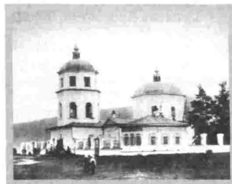
Киренск Церковь Спаса Нерукотворного Образа 1805–1815 гг.

вый сандрик на плечиках украшен рюмочками, а вместо широких лопаток, расчленяющих по проекту гладкие стены на прясла, контрастно сопоставлены темная бревенчатая поверхность и светлый орнаментированный фриз, что характерно для сибирского деревянного зодчества. К приходу были приписаны церкви: Иннокентьевская в селе Мутино, Спасская в селе Дубровском и пять деревянных часовен.