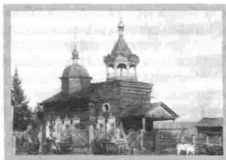
Деревня Горбова Церковь Казанской Иконы Божией Матери 1897 г.

Деревня впервые упоминается в документах в 1668 г. Вероятно, это была характерная для северных районов малодворка, поскольку первая церковь строится здесь только в 1862 г. В 1893 г. она сгорает, и вместо нее строят новую деревянную церковь, которую освятили 13 ноября 1897 г. во имя иконы Казанской Божией Матери. Храм приписали к приходу Воскресенской церкви села Чечуйск.