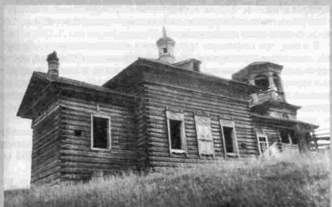
д. Мутино. Иннокентьевская церковь