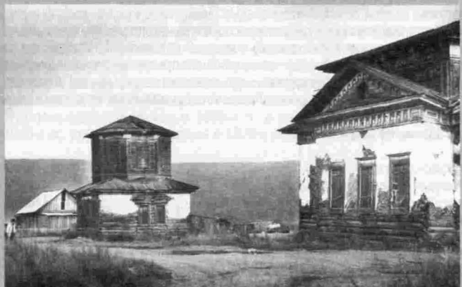
с. Чечуйск. Воскресенская церковь