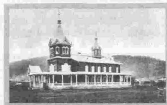
Киренск Монастырь Свято-Троицкий Церковь Преподобного Алексия Человека Божия 1891 г.

мая тогда Владимирской), очевидно, повлияли на своеобразный облик здания и его стилистику. Так, Троицкая церковь завершалась восьмикатным куполом, упрощенные грани которого перекликались с шатровой формой покрытия Николаевской церкви. Сходство между этими постройками можно уловить и в венчании колокольни каскадной кровлей со шпилем, и в необычном завершении апсиды шатриком.