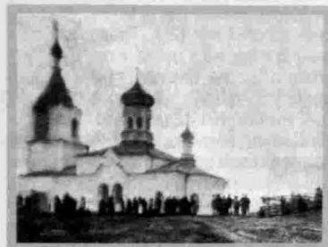
Село Кривая Лука Церковь Святителя Николая Чудотворца (каменная) 1898–1905 гг.

алтарь и западный притвор сложены с храмом едиными венцами, а не прирублены, как это предписывалось церковными правилами. Подобным образом рубились древние деревянные церкви, возводимые сибирскими первопроходцами, пока в конце XVII в. тобольский митрополит Симеон не приказал, чтоб «алтари у церквей были прирубные». Николаевская церковь — одна из немногих известных построек, в конструкции которой было нарушено это правило. Это свидетельствует о сохранении в отдаленных северных районах древних приемов народного зодчества, полностью утраченных в других, более обжитых местах. Убеждает в этом и характер декоративного убранства постройки, например, окна с лучковой перемычкой имеют выступающие колоды, превращенные в наличники.