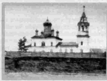
Деревня Макарово Церковь Пророка Илии (2-я) 1901 г.

В 1901 г. в селении была построена новая церковь, и служба в старом ветхом храме была прекращена, но он сохранялся до 1930-х гг.