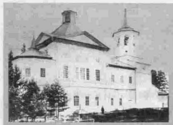
Киренск Монастырь Свято-Троицкий Церковь Пресвятой Троицы 1784—1817 гг.

церковь уничтожил пожар, и на ее месте в 1867 г. постановили памятную часовню. Часовня имела вид беседки, открытой со всех сторон. Завершалась она четырехкатной кровлей, над которой возвышался низкий глухой восьмерик, перекрытый лотковой кровлей с главкой. Внутри часовни у восточной стены стоял высокий крест. Постройка не сохранилась.