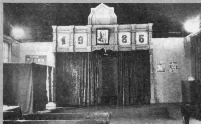
д. Краснояроро. Клуб в здании церкви

К приходу были приписаны три церкви: в селах в Горбово — Казанская, Баншиково — Скорбященская и Подволошино — Архангельская.