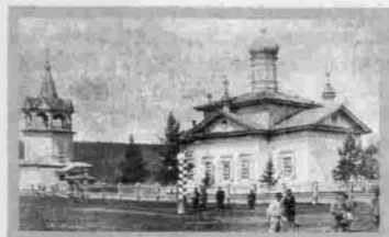
Село Чечуйск Церковь Воскресения Христового 1866—1868 гг.

Церковь сохранилась до наших дней в полуразрушенном состоянии. Как и все приленские церкви, она стоит на высоком берегу реки. Первоначальная объемно-пространственная композиция искажена — разрушена колокольня, возвышавшаяся ранее над притвором. К кубу храма с четырехскатной кровлей и одной небольшой главой примыкают более низкие трапезная и алтарь. Декор фасадов очень скромнен. Контрастно сопоставлены темные бревенчатые стены и белые, окрашенные элементы декора.