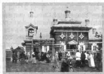
Село Ичера Церковь Святителя Николая Чудотворца 1900 г.

Темные рубленые стены контрастировали с белыми окрашенными деталями декоративного убранства, в которых эклектично сочетались элементы классицизма и барокко.