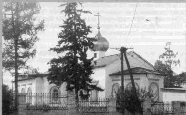
Киренск. Спасская церковь