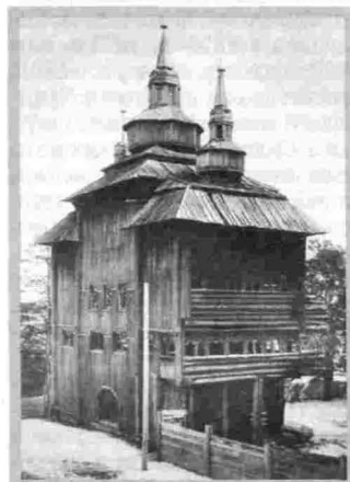
Киренск Монастырь Свято-Троицкий Церковь Свяителя Николая Чудотворца 1758–1785 гг.

монастырь епископ Иркутский Нил описал ее в своих путевых записках так: «стоящая над святыми воротами (церковь) заслуживает особого внимания. Размер ее, яко деревянного здания, огромный. На ней девять глав, из которых каждая основанием имеет отдельную пирамидальную башенку. А окна и балконы тянутся в несколько рядов, с прихотливыми уступами и резными фигурами. Вообще здание это таково, что в средние века в каждом городе и аббатстве, нашло бы оно для себя почетное место». Возможно, Иоанно-Предтеченская церковь частично уцелела от пожара, так как описание архитектурных характеристик не подходит ни к какому другому зданию монастыря. Иоанно-Предтеченская церковь была единственной девятиглавой церковью в Иркутской епархии, где даже пятиглавие в храмах встречалось крайне редко. Утрачена церковь, вероятно, в середине XIX в.