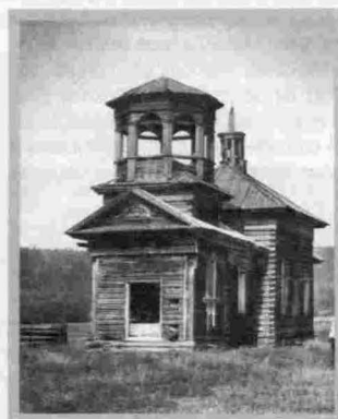
Деревня Мутина Церковь Св. Иннокентия, Епископа Иркутского 1898–1899 гг.

ны. Белые стены, имитирующие камень, сочетаются с темными деревянными элементами декора. Такой прием оформления фасадов впервые был использован в Иркутской епархии в 50-е гг. XIX столетия, а к началу XX в. стал традиционным.