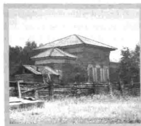
Село Красноярово Церковь св. Иннокентия, Епископа Иркутского 1915 г.

XVIII в. игуменом монастыря Вонифатием. Иконостас в начале XX в. был двухъярусный, позже верхний его ярус был снят и передан в церковь Алексия Человека Божия, устроенной над могилой основателя монастыря предподобного Гермюгена.