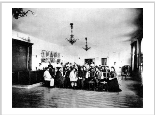
Рис. 4. Зал во время приема больных.