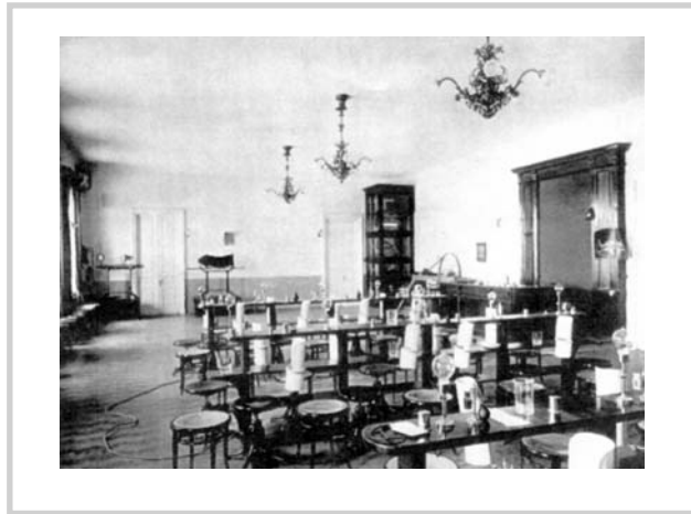
Рис. 5. Анатомический кабинет.