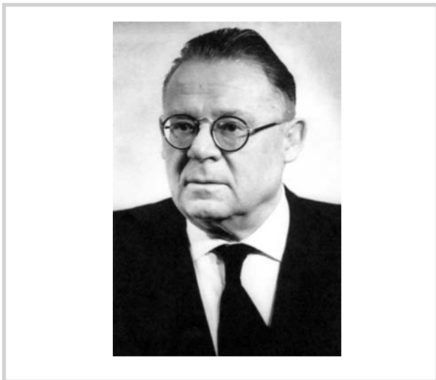
Рис. 9. Член-корр. АМН СССР А.Г. Лихачев.