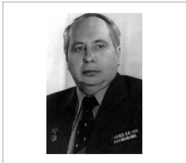
Рис. 10. Акад. АМН СССР Н.А. Преображенский.

А.Г. Лихачев с 1942 по 1948 г. был ректором I ММИ. Он принимал участие в организации Московского НИИ уха, горла и носа, в создании журнала «Архив патологии». Был главным оториноларингологом МЗ СССР, председа-