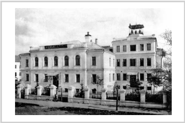
Рис. 2. Фасад Московской ЛОР-клиники им. Ю.И. Базановой.