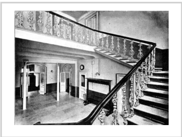
Рис. 3. Вестибюль Московской ЛОР-клиники им. Ю.И. Базановой.