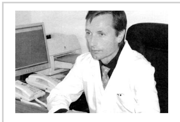
Рис. 12. Проф. А.С. Лопатин.

Клиника сегодня — высокий уровень микрохирургических операций на ухе, эндоскопических вмешательств на околоносовых пазухах, основании черепа и соседних органах, эндоларингеальных операций, лечения расстройств обоняния, болезни obstructивного апноэ сна, периферических кохлеовестибулярных расстройств, системы документации диагностических находок и многое другое. В структуру клиники входят 2 клинических, консультативное и аудиологическое отделения, отделение эндоско-