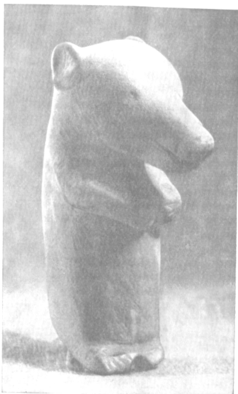
Медведь. Скульптура из Самусек.

другая тоже согнута в локте, но поднята кверху. Ноги фигурки тоже слегка изогнуты. Человечек как будто обращается к кому-то с речью или с вопросом.